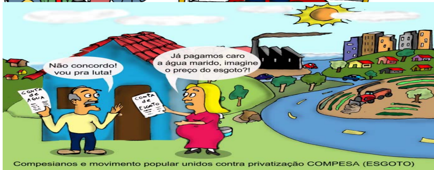
Compesianos e movimento popular unidos contra privatização COMPESA (ESGOTO)